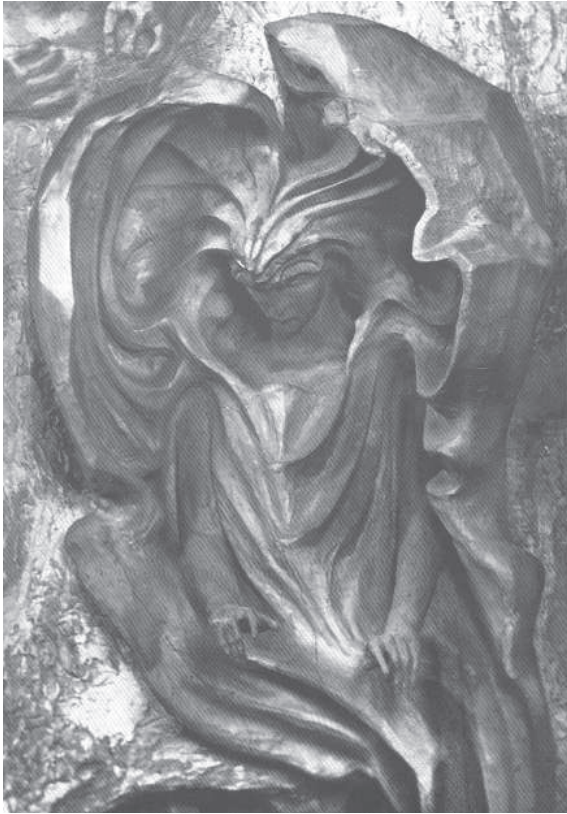
Rudolf Steiner: Lucifer (Ausschnitt aus der Holzplastik des Menschheitsrepräsentanten)

pulsen handeln konnte, die von luziferischen Wesen angeregt sind.