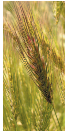
Wildgetreide Dasypyrum villosum , Versuchsanbau Lichthof