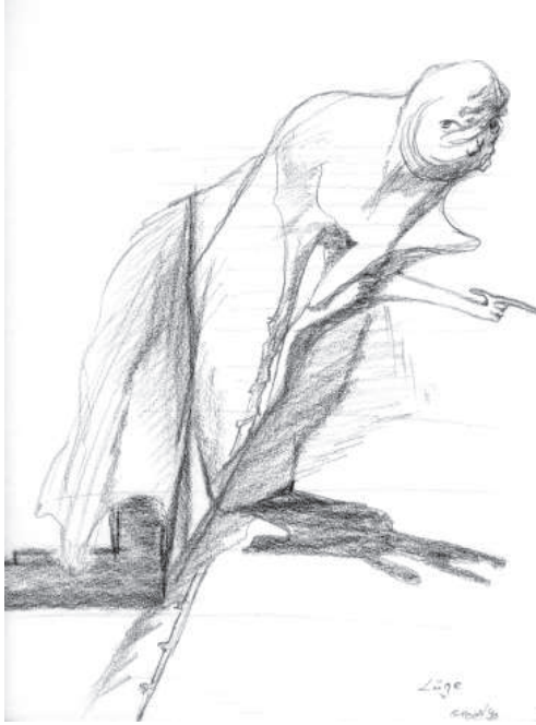
E. Beringer: Lüge

Für unsere Betrachtung wichtig sind nun solche Elementarwesen, deren Ursprung der Mensch und die durch ihn geschaffene Technik ist. 57 Diese vom Menschen stammenden Elementarwesen sind häufig solche, die in der Natur einen störenden und schädigenden Einfluss ausüben.