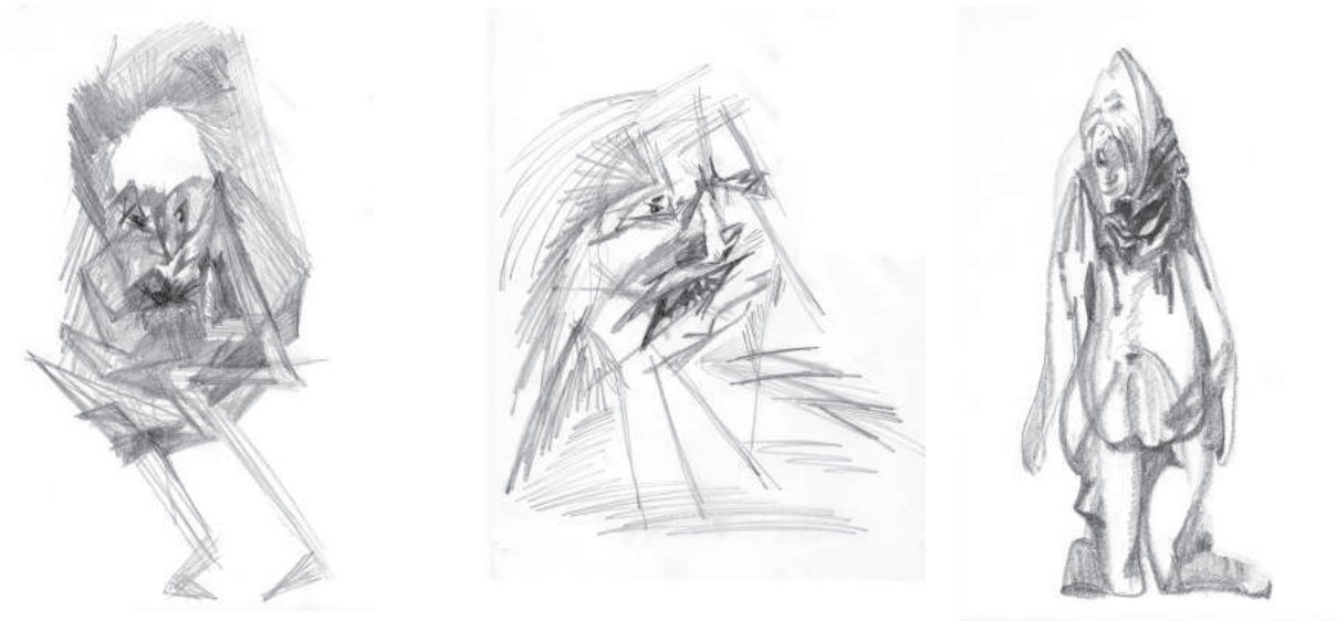
E. Beringer: Imaginationen von Elementarwesen, entstanden aus Furcht, Hass, Willensschwäche

Das Heer dieser durch den Menschen entstandenen Elementarwesen vergrößert sich ständig. Elementarwesen haben kein Ich wie der Mensch. Sie sind in ihren Taten nicht frei, sondern führen aus, wozu die leitenden Wesen der höheren Hierarchien sie beauftragt haben.