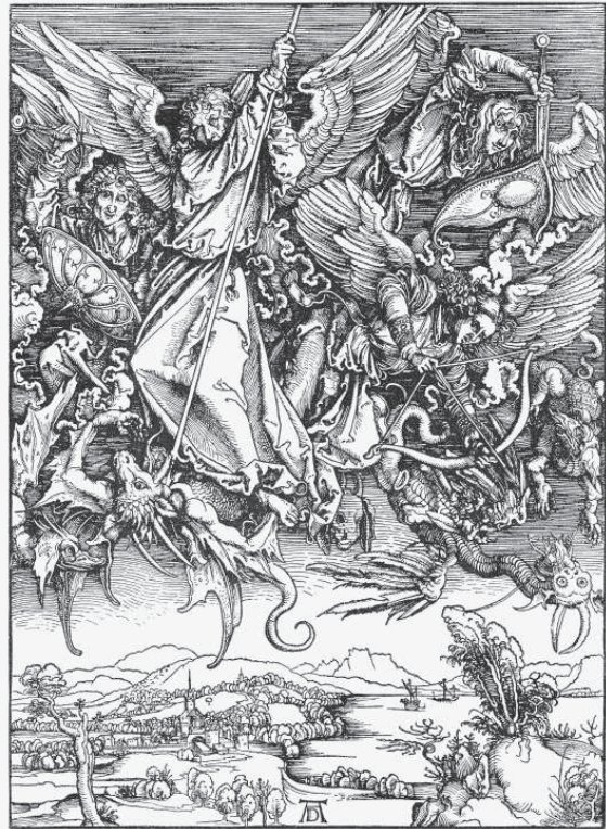
Albrecht Dürer : Erzengel Michael

So ist es auch und gerade in den Sphären, die hinter oder über der sinnlichen Welt liegen. Doch diese Wesen sind auch dem Hellseher anfänglich noch nicht wahrnehmbar. Erst auf einer höheren Stufe seiner Schulung kann er gewahr werden, dass alle Prozesse in der Lebenswelt Ausdruck sind der Tätigkeit geistiger Wesen und ihrer Helfer. Diese geistigen oder göttlichen Wesenheiten werden in der Anthroposophie in der Regel mit den Namen der christlichen Tradition der Bibel oder des