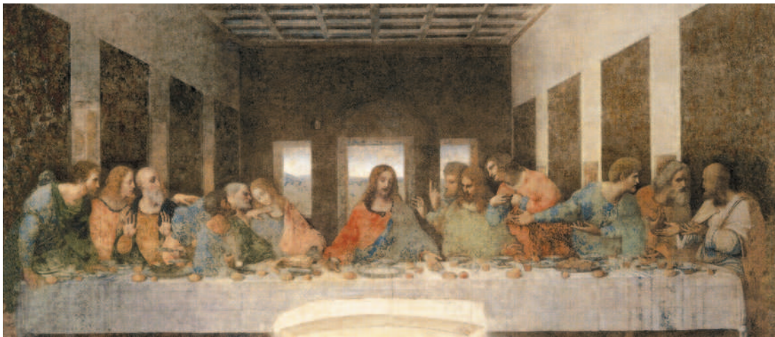
Leonardo da Vinci: Abendmahl

„Das ist das Große, das in der damaligen Zeit