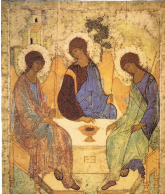
A. Rublew: Dreifaltigkeit

und über mächtige Kräfte und Fähigkeiten verfügen.