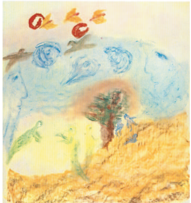
R. Steiner: Elementarwesen

In dieser Äthersphäre leben Wesenheiten, die man Elementarwesen nennt, und die an der Gestaltung der Naturvorgänge wirken 55 . Sie führen die Impulse aus, die höhere hierarchische Wesenheiten in die Erde hinein senden. Sie schaffen in den Elementen der Erde, im Festen, Flüssigen, Gasförmigen und in der Wärme, aber auch in den Lebensvorgängen des Lichtes, im Chemismus, in Lebens- und Todesprozessen. Diese elementarischen Wesenheiten bilden ein vielfältiges und vielgestaltiges Reich. Es sind Wesen, die unseren