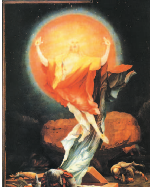
Matthias Grünewald: Auferstehung - Isenheimer Altar

Durch das Christusopfer wurde dem Ich die wahre Freiheit gegeben. Aus Seinen Kräften kann es allmählich die Herrschaft über die See-