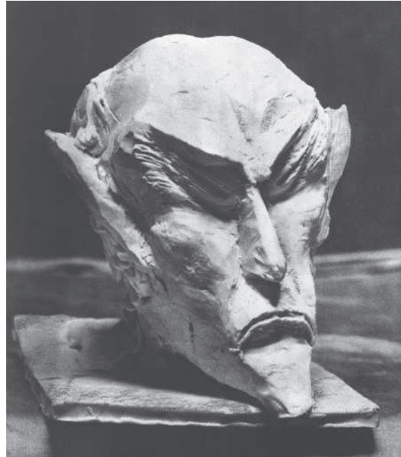
Rudolf Steiner: Ahriman-Kopf (Entwurf)

„Im Erdenleben führt die Gewalt Ahrimans dazu, das sinnlich-physische Dasein als das einzige anzusehen und sich dadurch jeden Ausblick auf eine geistige Welt zu versperren. In der geistigen Welt bringt diese Gewalt den Menschen zur völligen Vereinsamung, zur Hinlenkung aller Interessen nur auf sich.“ 14