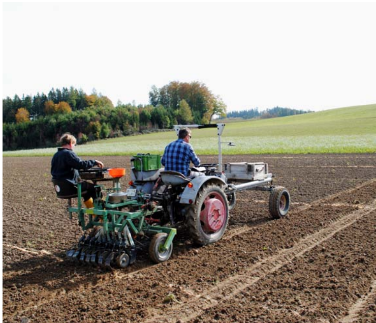
Die Arbeit muss weitergehen für qualitativ gute Weizensorten!

Dieses Protein hat eine sehr stabile, kompakte Struktur, die beim Kochen und Backen nicht zerstört wird. Deshalb wird es auch nur unvollständig verdaut, zumal es selber das Trypsin und damit die eigene Verdauung hemmt. Wenn dieses unverdaute ATI in die Poren der Darmschleimhaut eindringt, wird es von den allgegenwärtigen Zellen des angeborenen Immunsystems erkannt und beseitigt. Erst im Überschuss kommt es zu einer Entzündung mit Verdauungsproblemen. Diese Grenze wird bei Dinkel und Emmer nur selten erreicht, daher die bessere Verträglichkeit.